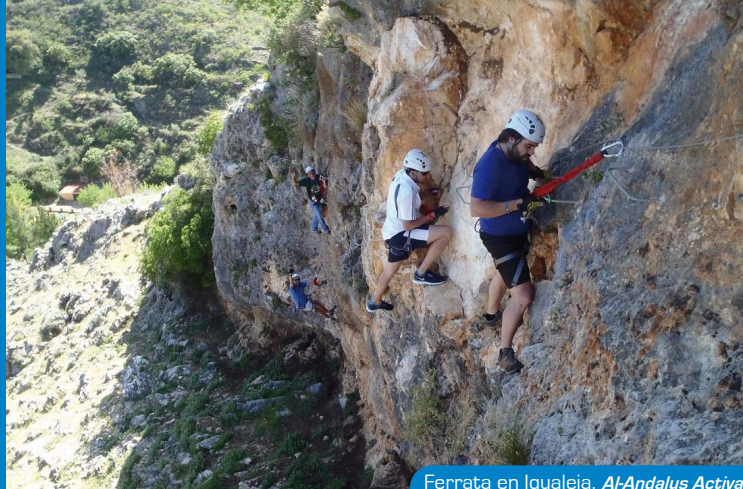
Ferrata en Igualeja. Al-Andalus Activa