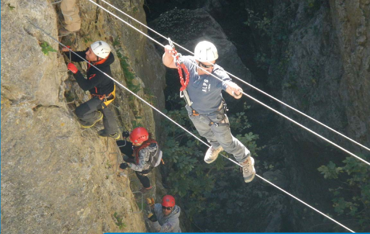
Puente de mono en Benalauría. Manuel García. PANGEA CENTRAL