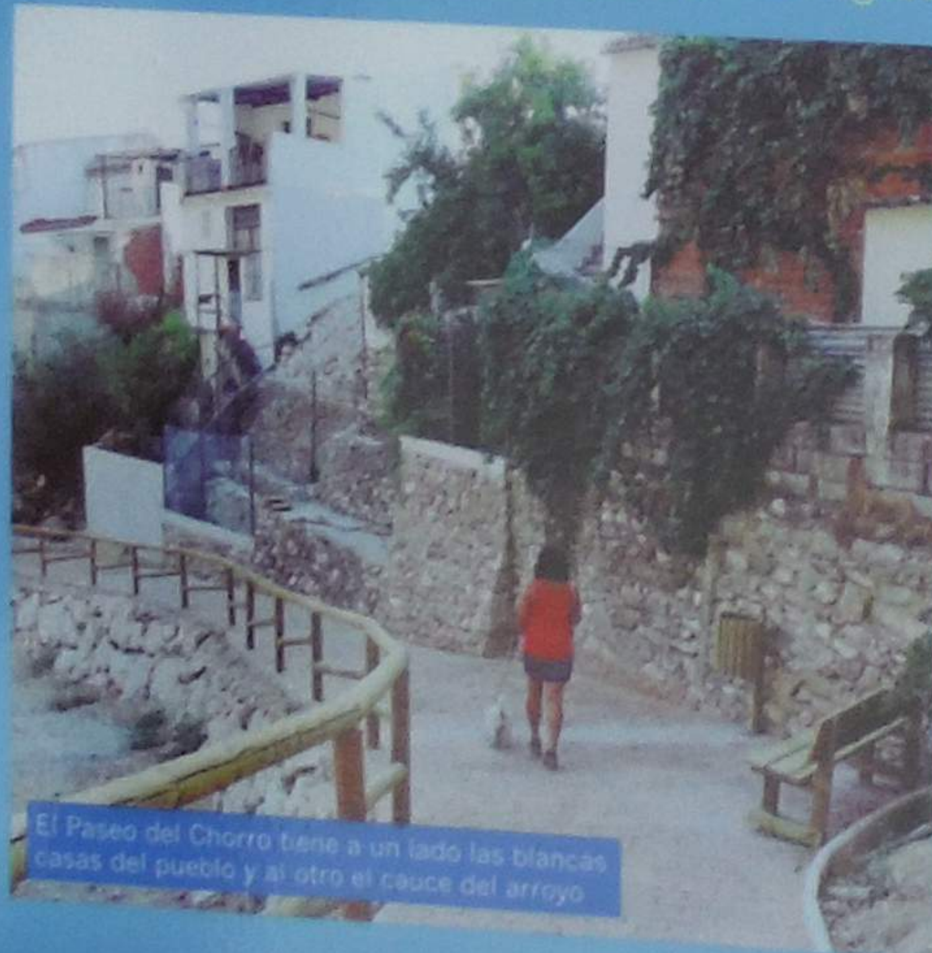
El Paseo del Chorro tiene a un lado las blancas casas del pueblo y al otro el cauce del arroyo