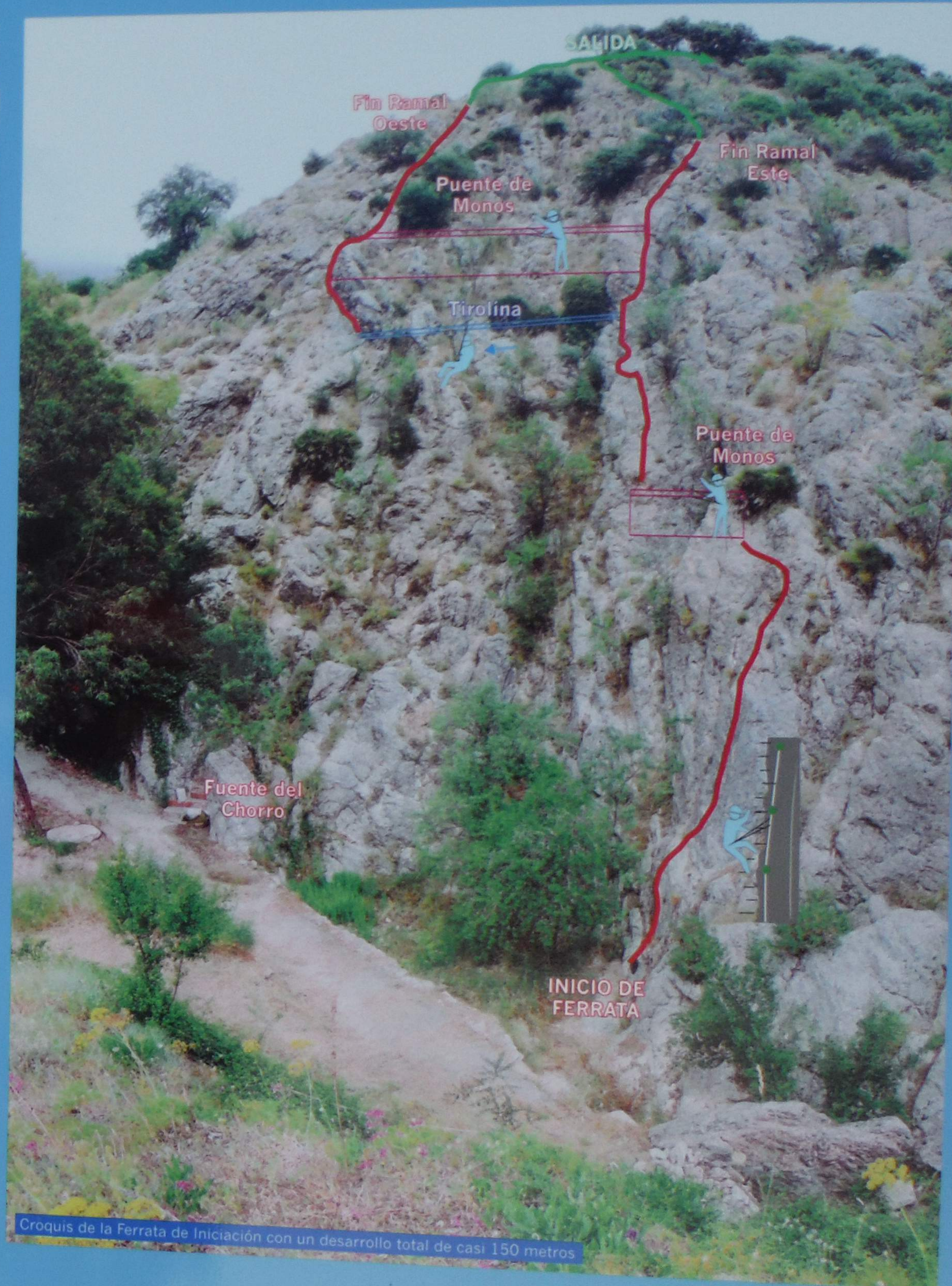
Croquis de la Ferrata de Iniciación con un desarrollo total de casi 150 metros