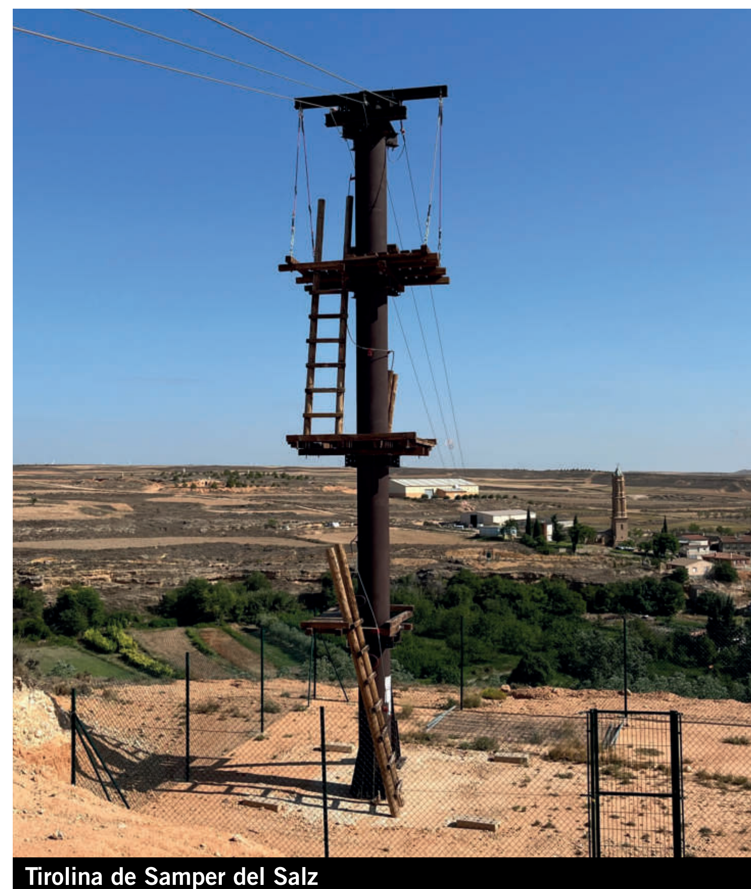
Tirolina de Samper del Salz