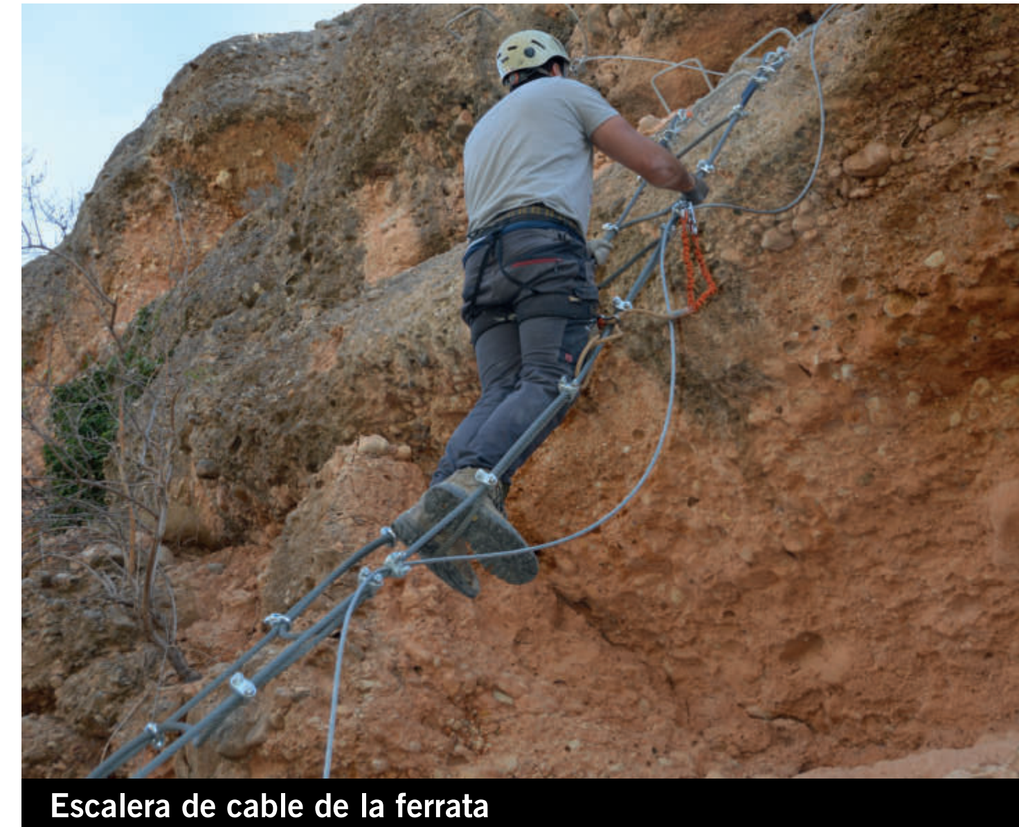
Escalera de cable de la ferrata

La vía ferrata Aguasvivas permite salvar las paredes de conglomerado, erosionadas por el río Aguasvivas que le da nombre, y disfrutar de unas bonitas vistas del valle y el pueblo. Se trata de una vía corta, pero que consta de varios pasos en los que los visitantes tendrán que esforzarse para poder superarlos.