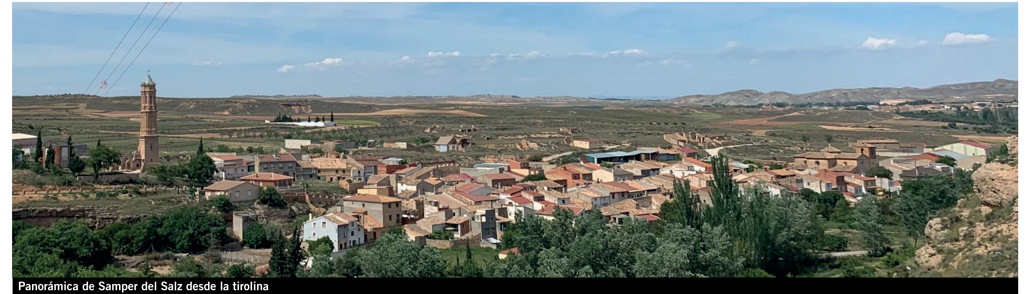
Panorámica de Samper del Salz desde la tirolina