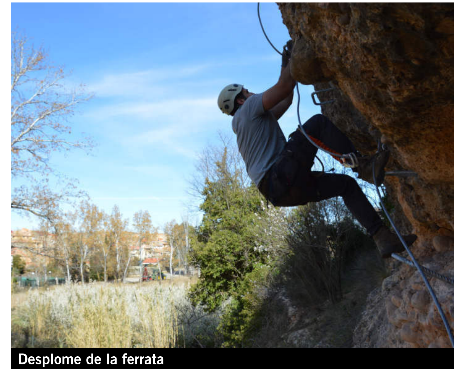
Desplome de la ferrata