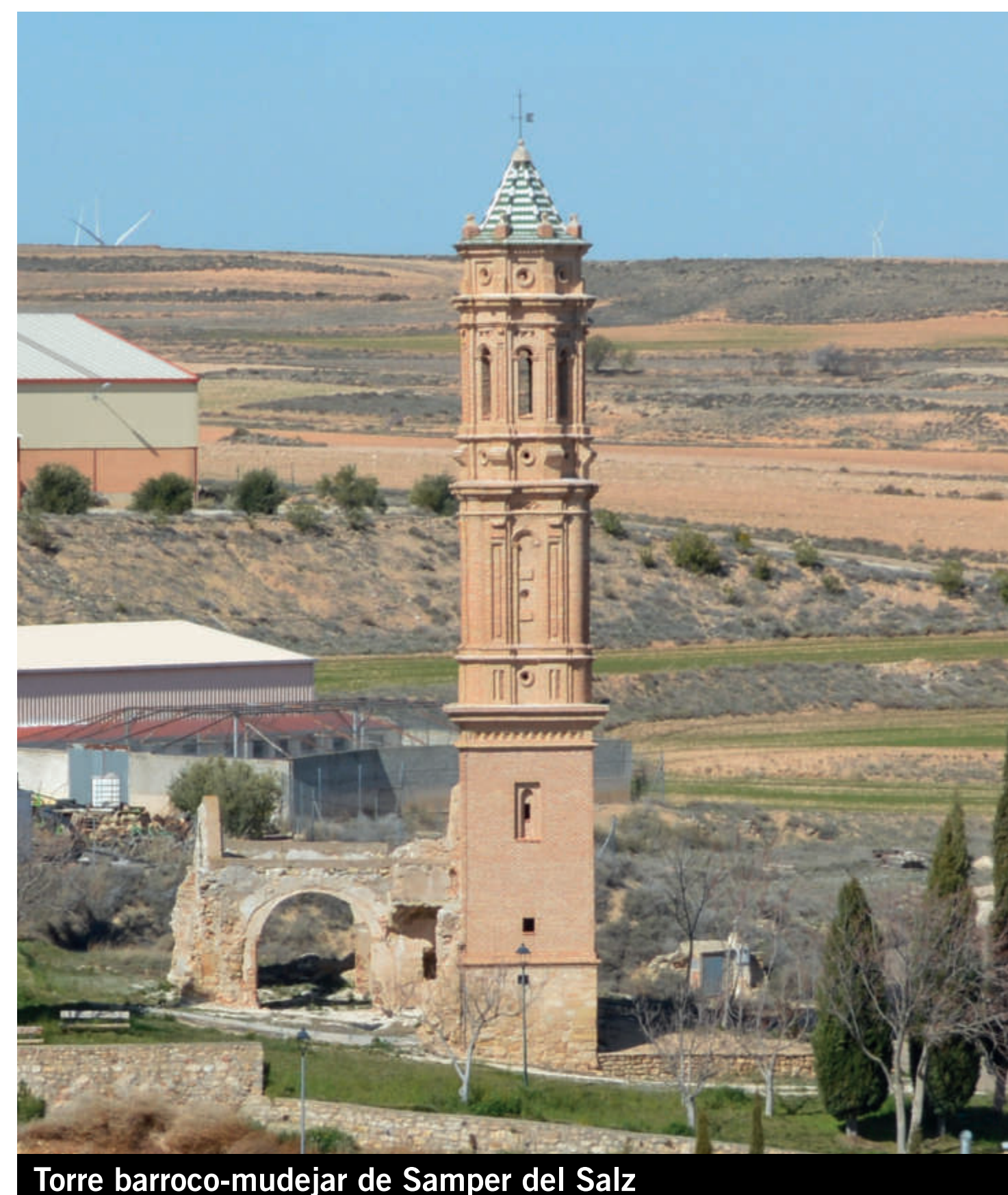
Torre barroco-mudejar de Samper del Salz