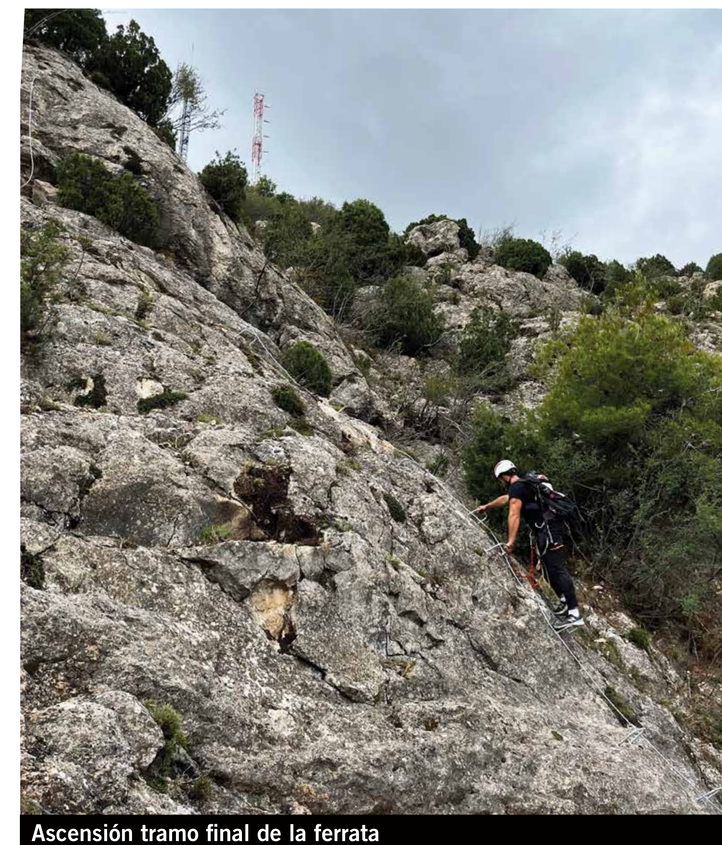
Ascensión tramo final de la ferrata