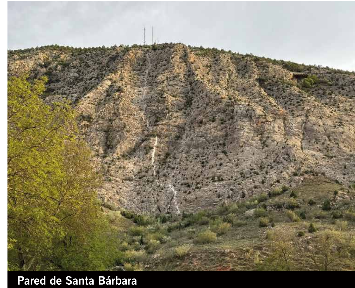
Pared de Santa Bárbara

La ferrata de “La Bárbara” debe su nombre al monte sobre el que se ubica la mayor parte de su recorrido, Santa Bárbara, de 1104 m de altura al que ascenderemos tras superar dos puentes, uno de ellos de 70 m, y varios tramos de grapas en los que habrá que buscar ayuda en la roca para poder progresar.