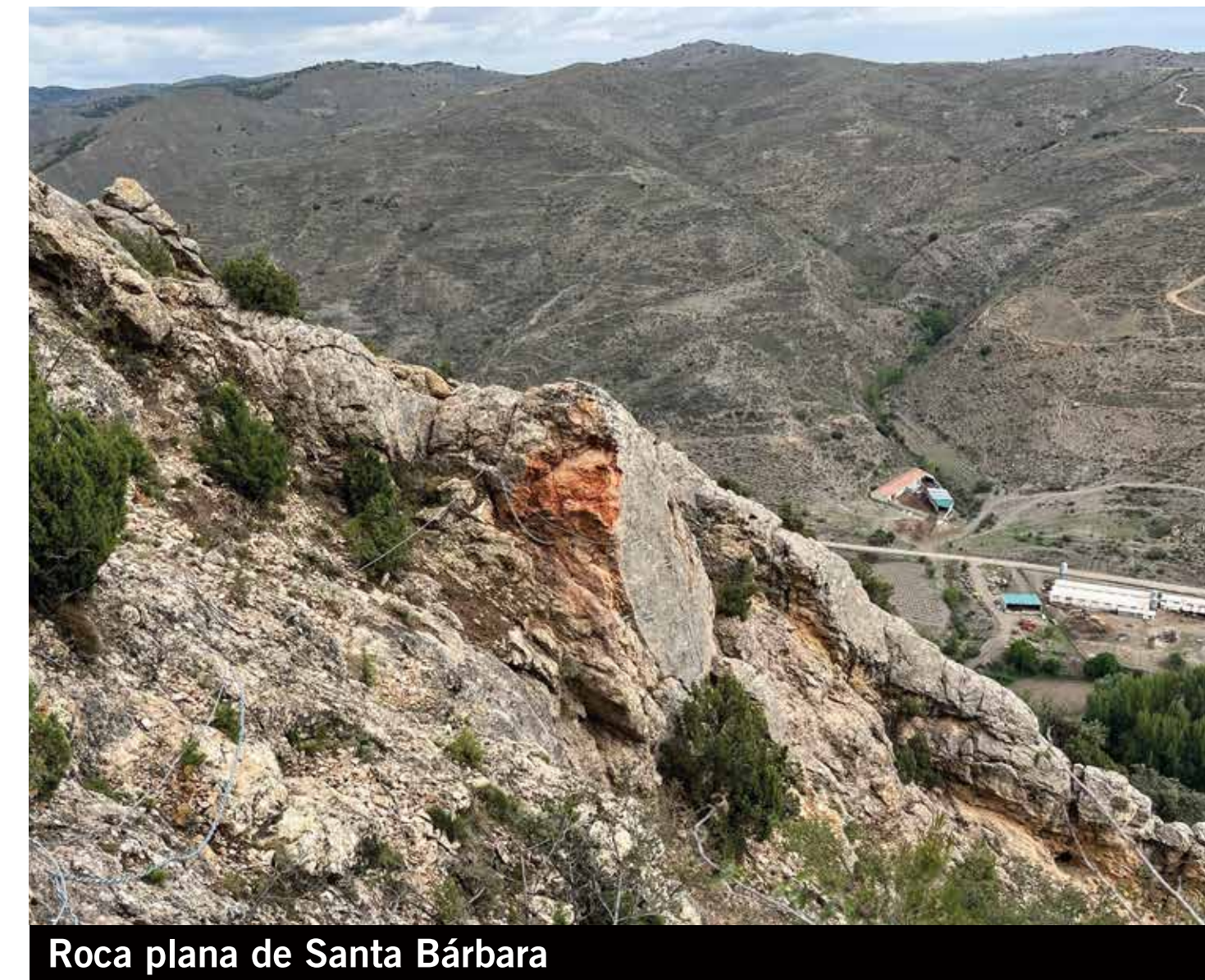
Roca plana de Santa Bárbara