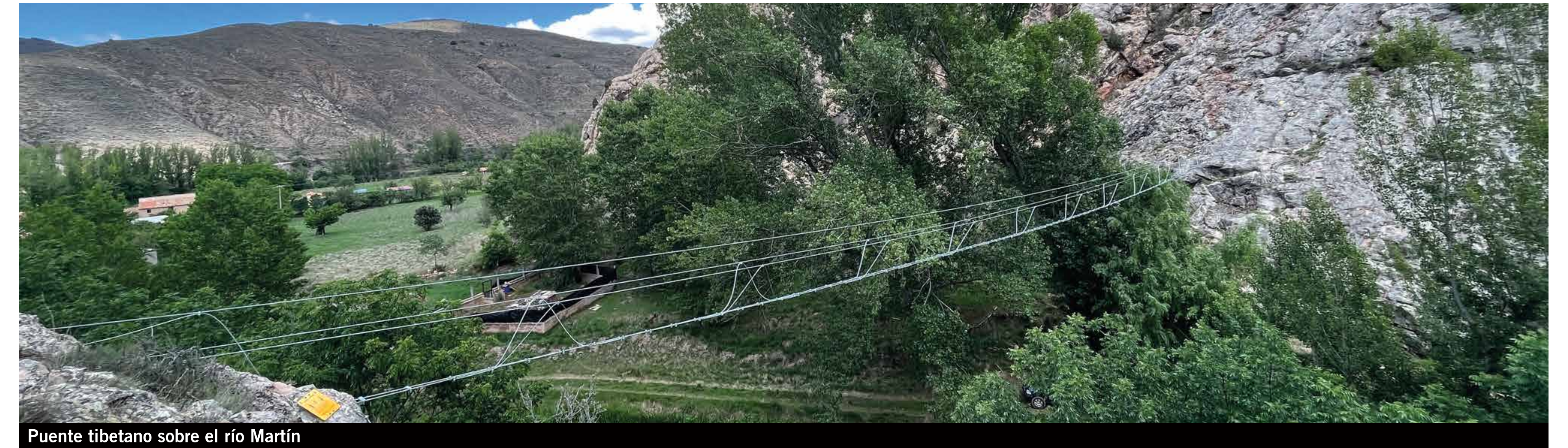
Puente tibetano sobre el río Martín