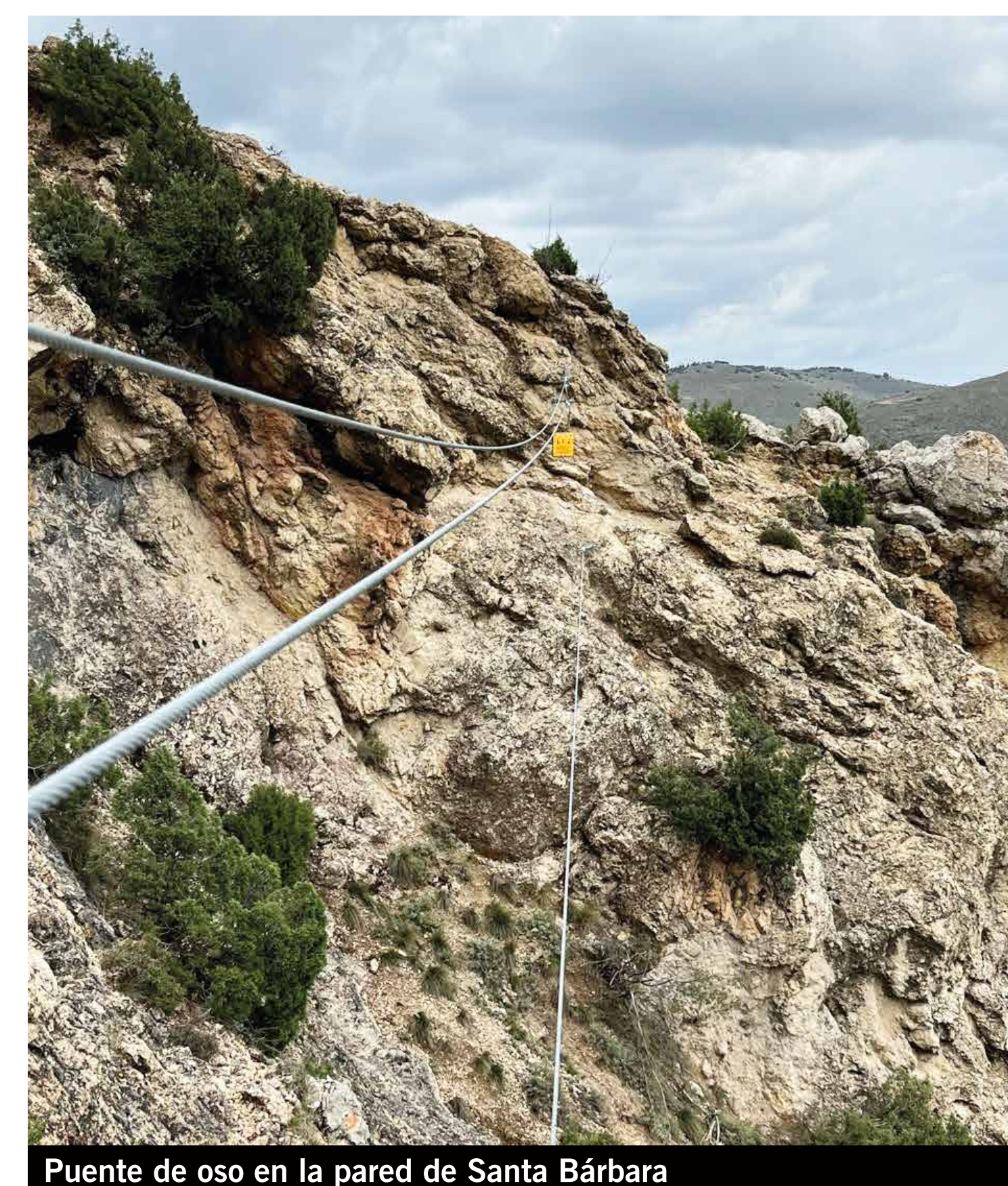
Puente de oso en la pared de Santa Bárbara