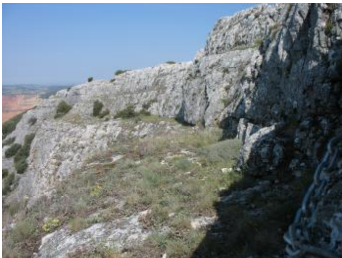
Repisa amplia antes del comienzo de las dificultades