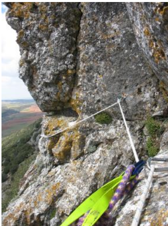
Marco Aurelio durante la apertura de la primera fase