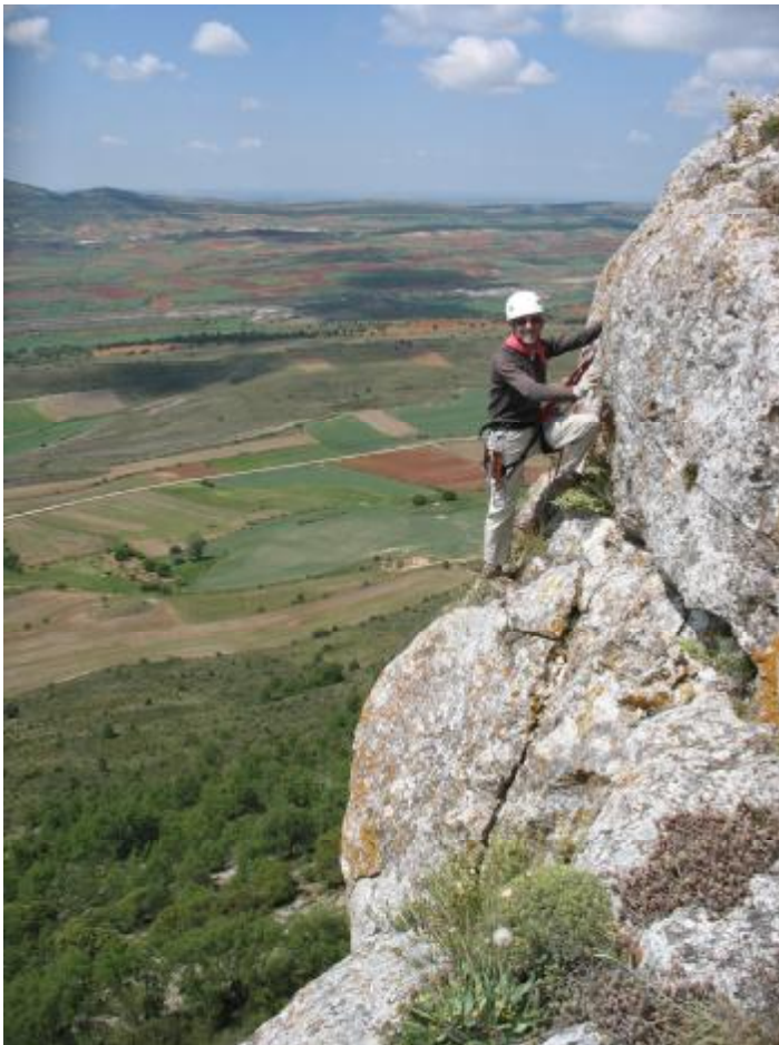
Comienzo del tramo final

Nos acercamos a la salida , desde aquí casi veremos los escalones y el agarradero final