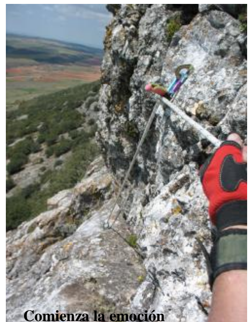
Comienza la emoción